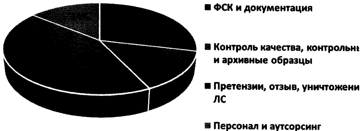
Виды нарушений, выявленных в 2020 г.

Результаты проверок юридическими лицами не обжаловались.